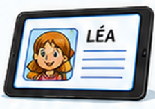
Capture avec un prénom visible