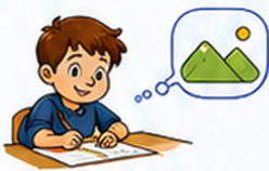
Photo d'un dessin sans personne